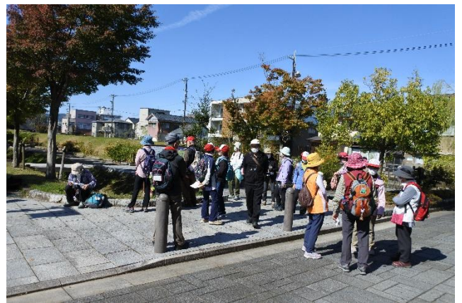
御泉水公園にて小休止