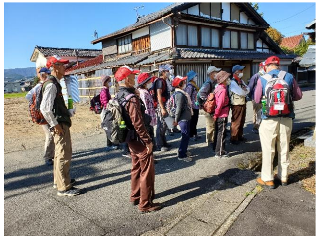
松森町の往還一里塚にて説明を聴く